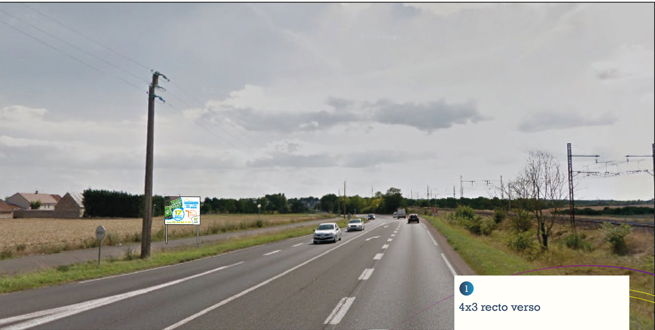
1 4x3 recto verso