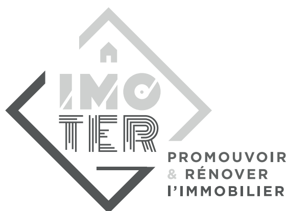
Logo niveaux de gris