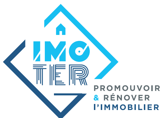
Logo Quadri lettrage gris et couleurs QUADRI