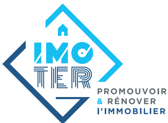
Logo Quadri lettrage gris et couleurs