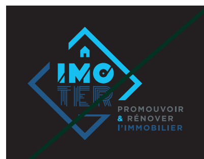
Logo Blanc sur fond de couleur uni