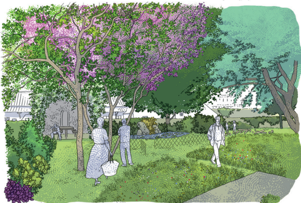
2 L'ESPACE CONVIVIALITÉ