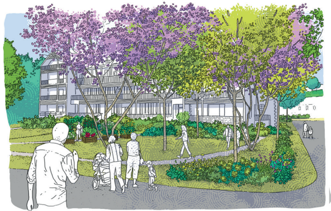
3 LES CARRÉS POTAGER