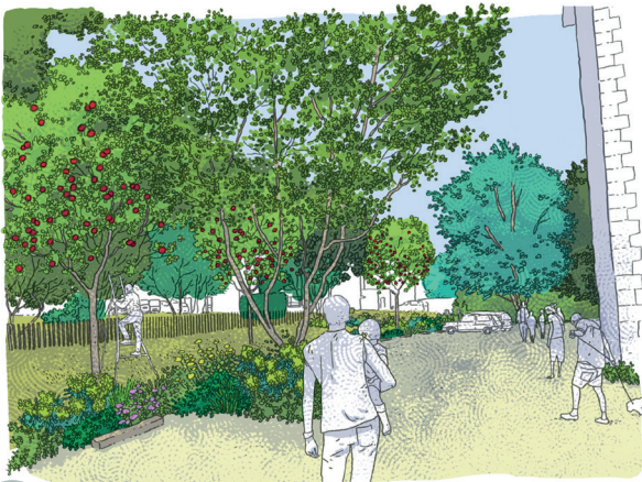
1 LE VERGER