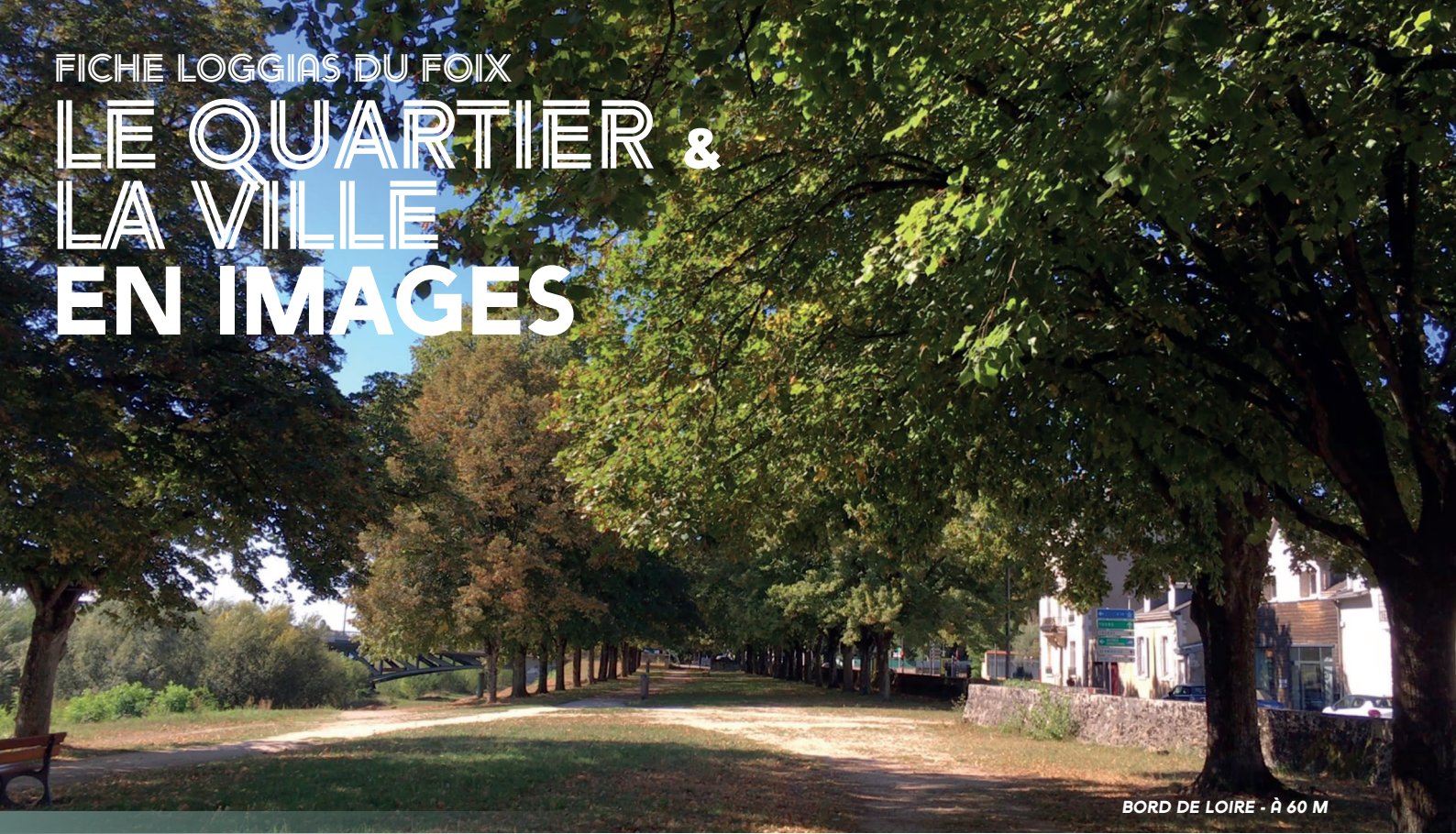
BORD DE LOIRE - À 60 M