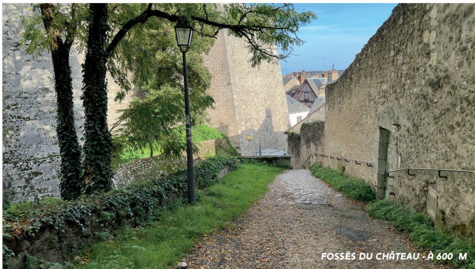
FOSSÉS DU CHÂTEAU - À 600 M