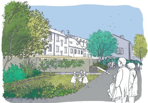
4 L'ESPACE DE COMPOSTAGE