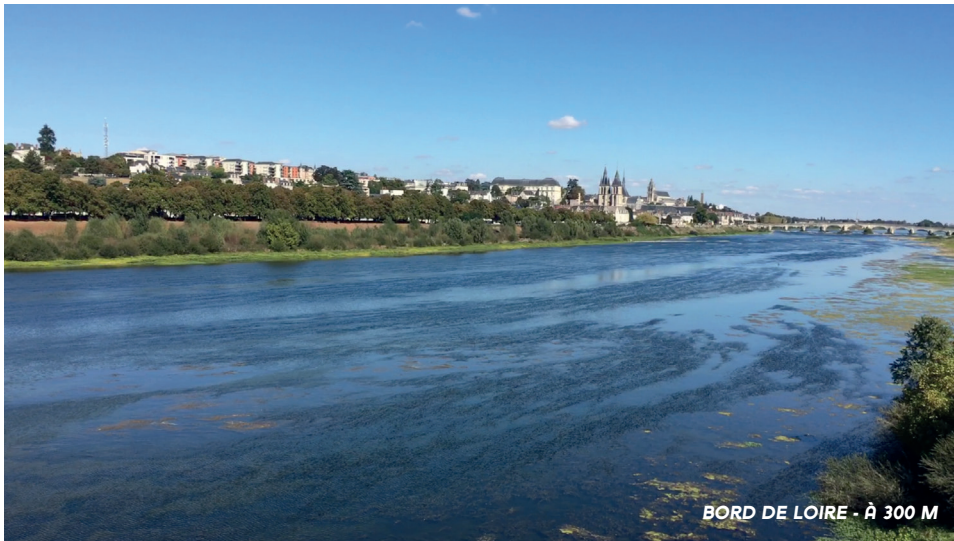
BORD DE LOIRE - À 300 M