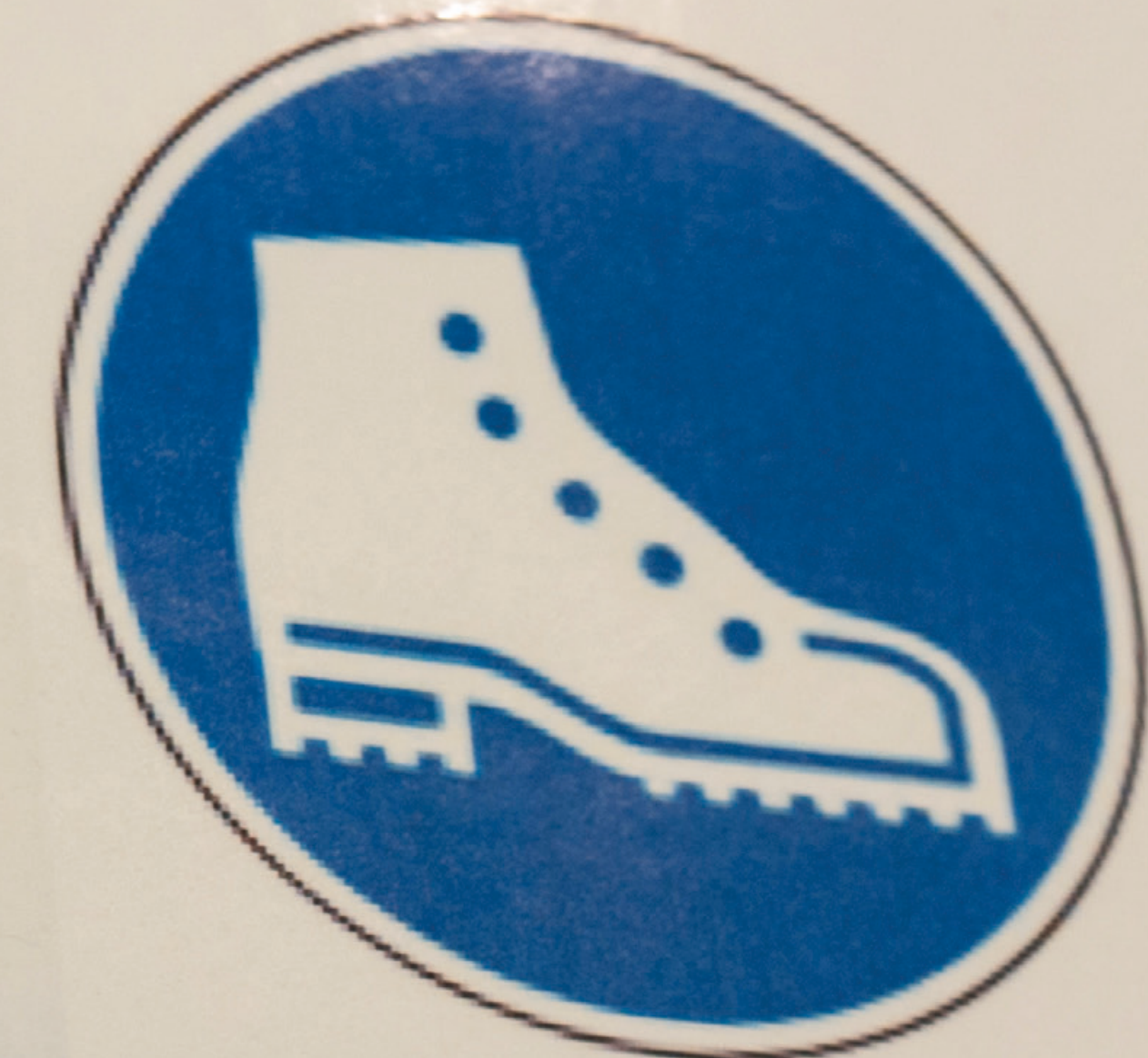
PORT DES CHAUSSURES DE SÉCURITÉ OBLIGATOIRE