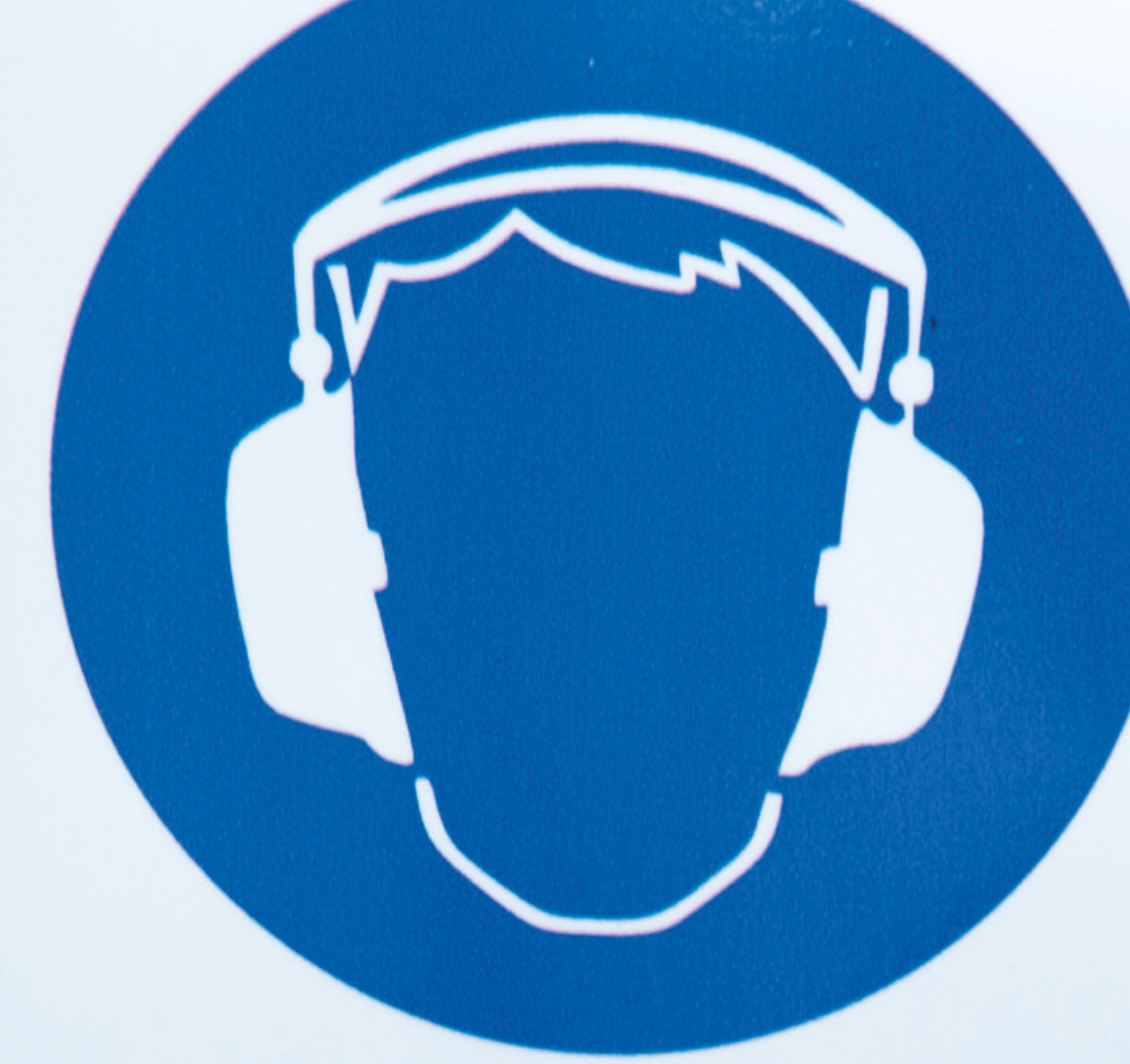
Port de protections auditives 111617110111

Respectez la signalisation en place ! Respect warning signs !