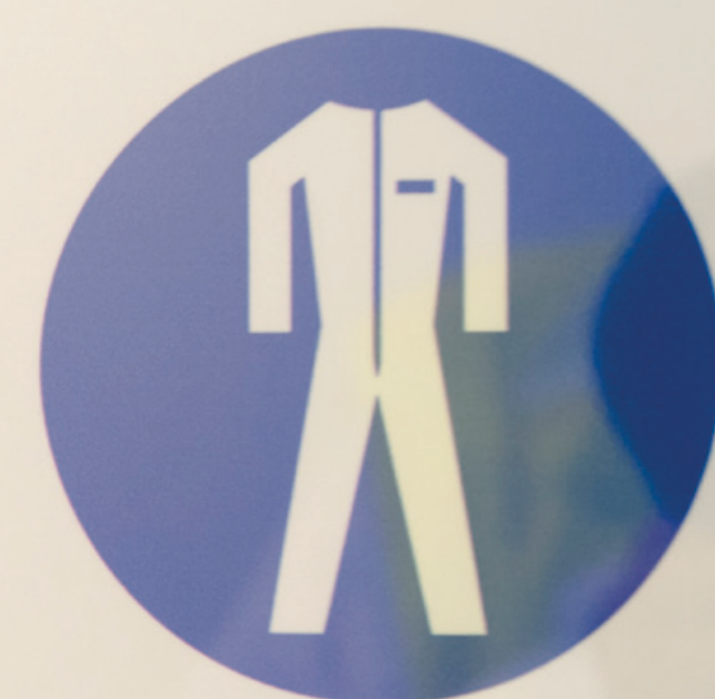
Blouse coton en manipulation