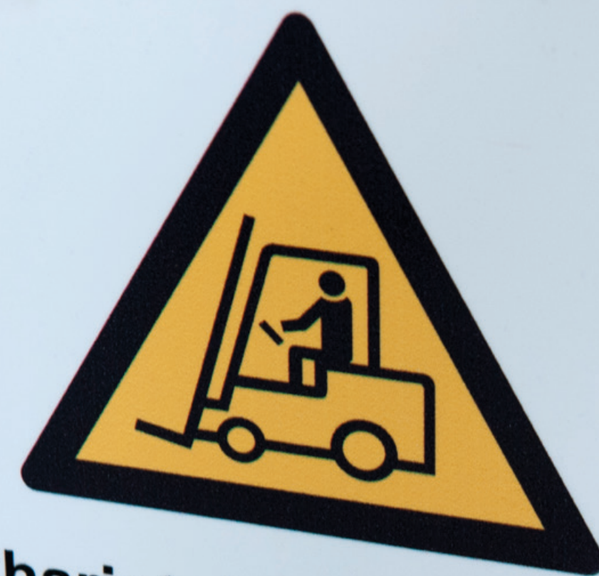
Chariot de manutention