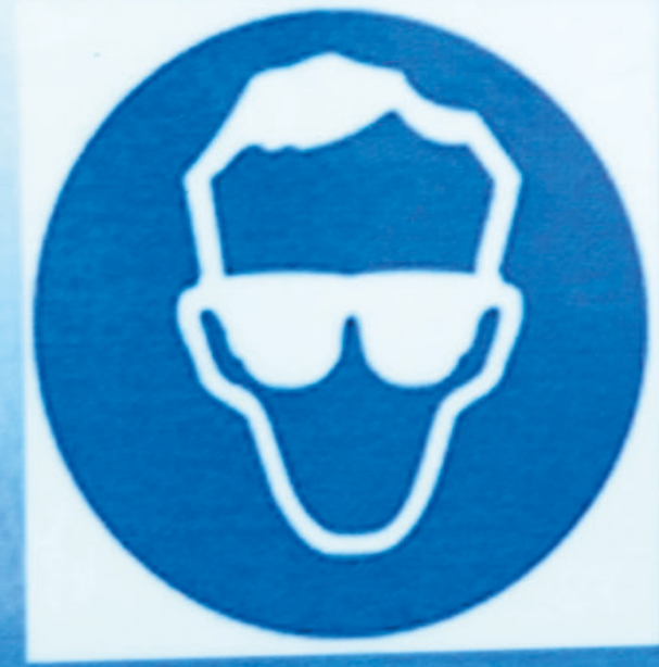
Port de lunettes de sécurité obligatoire