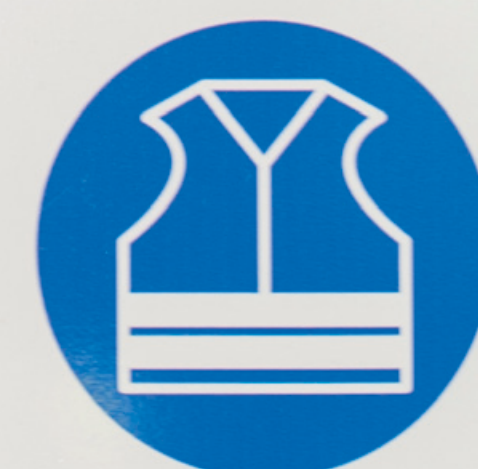
Gilet de haute visibilité