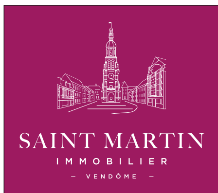
Logo TOUT Blanc : fond transparent et lettrage blanc