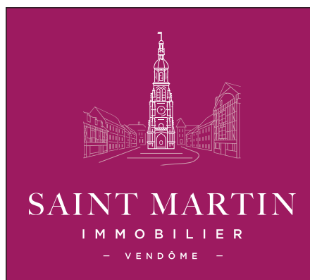
Logo Blanc transparence ville : fond transparent lettrage blanc et ville transparence 50%